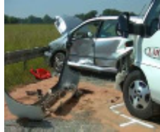
Schwerer Unfall auf der Waren-dorfer Straße