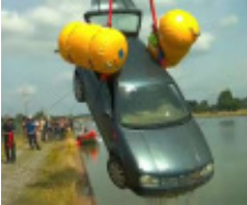
VW Golf liegt im Dortmund-Ems-Kanal