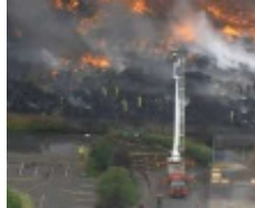
Fliegender Lampion verursacht Großbrand